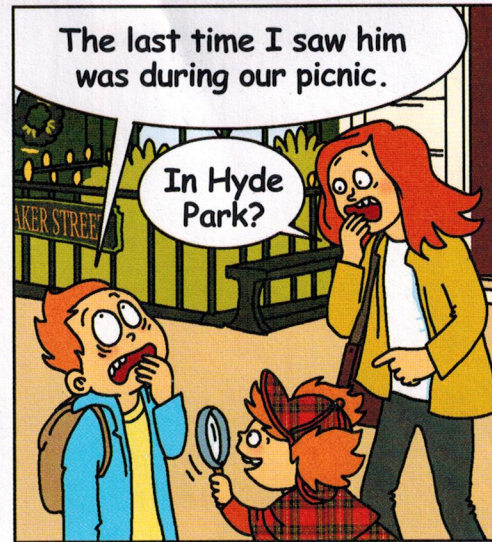
— La dernière fois que je l'ai vu, c'était pendant notre pique-nique. — À Hyde Parc?