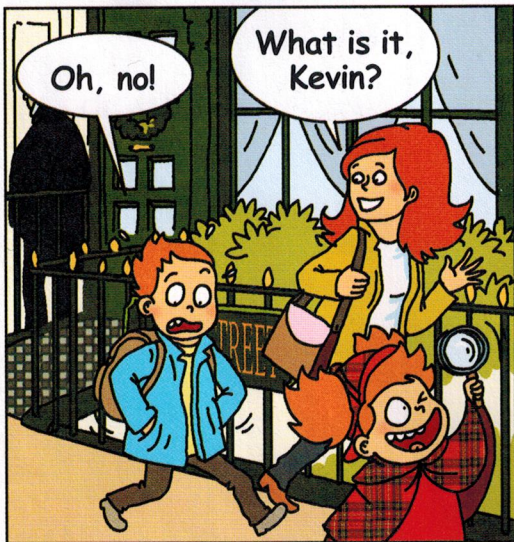
— Oh, non!