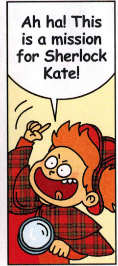
— Ah, ah! Voici une mission pour Sherlock Kate!