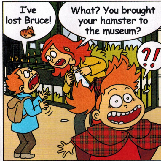
— J'ai perdu Bruce!