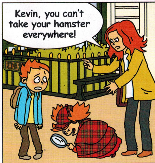
— Kevin, tu ne peux pas emmener ton hamster partout!