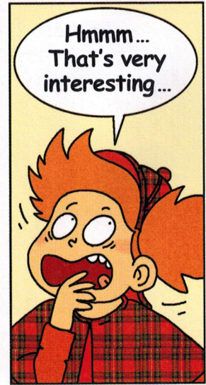
— Hum, hum... Très intéressant...